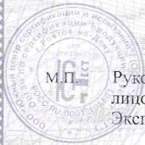
Схема сертификации - 2. Плановый инспекционный контроль - один раз в год.

М.П. Руководитель (уполномоченное лицо) органа по сертификации Эксперт